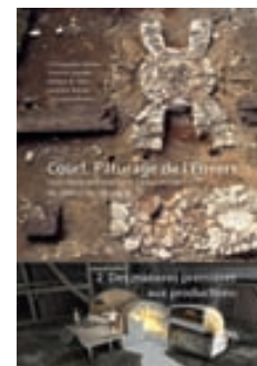
Volume 2: DES MATIÈRES PREMIÈRES AUX PRODUCTIONS

Avec les contributions de Christoph Brombacher, Angela Schlumbaum, Nicolas Stork, Lucia Wick 2010; 202 pages; CHF 46.– ISBN 978-3-907663-26-4